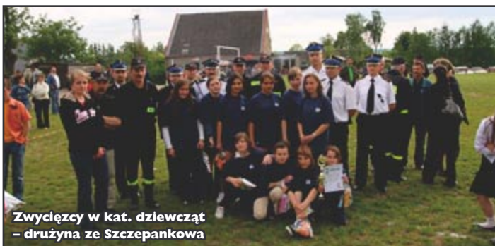
Zwycięzcy w kat. dziewcząt - drużyna ze Szczepankowa