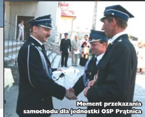
Moment przekazania samochodu dla jednostki OSP Prątnica