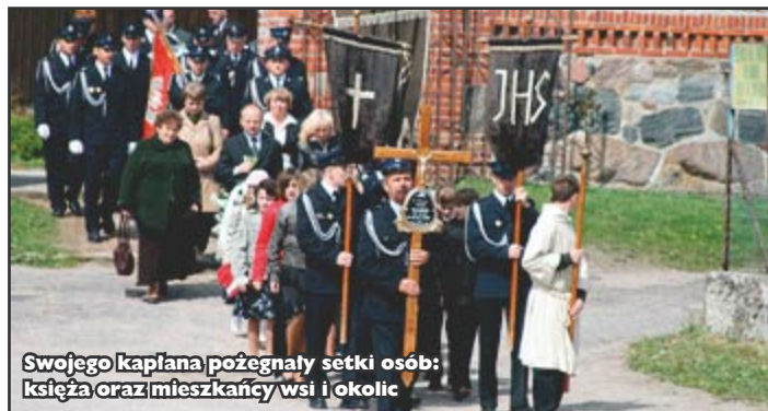
Swojego kapłana pożegnały setki osób: księży oraz mieszkańcy wsi i okolic