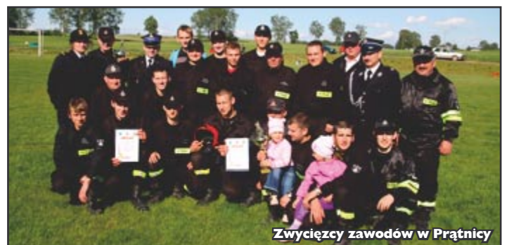
Zwycięzcy zawodów w Prątnicy

KLASYFIKACJA GENERALNA 1. OSP Rożental 2 – 115,03; 2. OSP Rożental 1 – 115,56; 3. OSP Omule – 117,45; 4. OSP Prątnica – 119,14; 5. OSP Rakowice – 119,18; 6. OSP Targowisko – 122,75; 7. OSP Złotowo – 125,06; 8. OSP Tuszewo – 130,94; 9. OSP Rumienica – 134,44; 10. OSP Lubstyniek – 144,13; 11. OSP Byszwald – 147,32; 12. OSP Kazanice – 150,87; 13. OSP Szczepankowo – 153,78; 14. OSP Władki – 162,56; 15. OSP Łążyn – 213,19