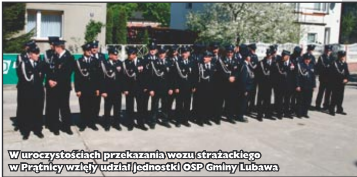
W uroczystościach przekazania wozu strażackiego w Prątnicy wzięły udział jednostki OSP Gminy Lubawa