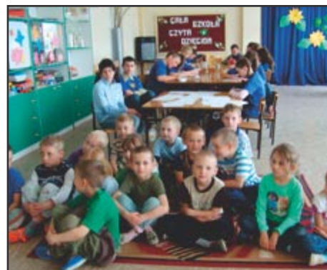
Sluchacze nagradzali lektorów brawami, śpiewając piosenki lub wręczając własnoręcznie zrobione rysunki