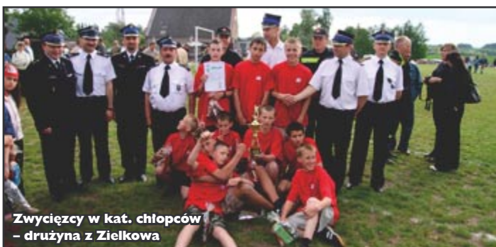
Zwycięzcy w kat. chłopców - drużyna z Zielkowa