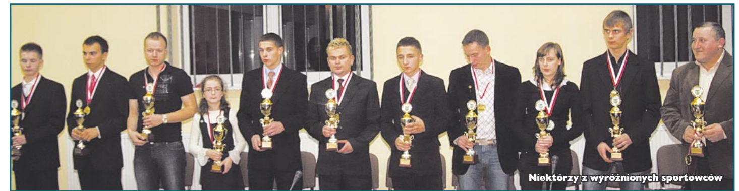
Niektórzy z wyróżnionych sportowców