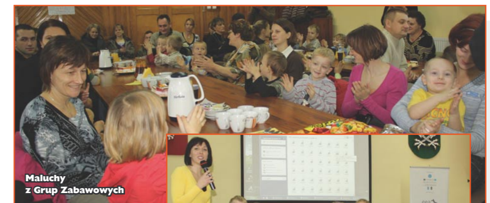
Maluchy z Grup Zabawowych

Natomiast upowszechnianie alternatywnych form edukacji przedszkolnej dla dzieci w wieku 3-5 lat przez okres ostatnich kilku lat doprowadziło do funkcjonowania obecnie na terenie gminy Lubawa 13 Grup Zabawowych. Łączna liczba dzieci uczęszczających na zajęcia wynosi 186.