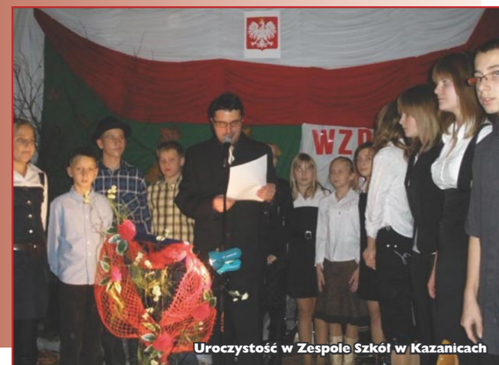
Uroczystość w Zespole Szkół w Kazanicach

W sytuacji wyjątkowej, np. wydanie aktu zgonu, należy kontaktować się z kierownikiem USC w Lubawie, tel. 89 645 24 70.