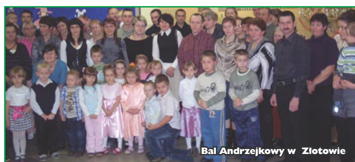
Bal Andrzejkowy w Żłotowie