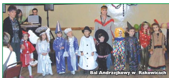
Bal Andrzejkowy w Rakowicach