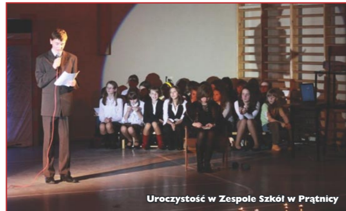
Uroczystość w Zespole Szkół w Prątnicy

Podobna uroczystość odbyła się także w Zespole Szkół w Prątnicy. Tradycyjnie na sali gimnastycznej spotkali się liczni mieszkańcy miejscowości i okolic a młodzież przedstawiła poruszający montaż słowno-muzyczny, podczas którego można było posmakować pysznego ciasta i napić się kawy czy herbaty.