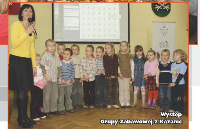
Występ Grupy Zabawowej z Kazanic