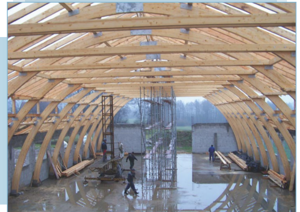
Etap budowy z końca listopada