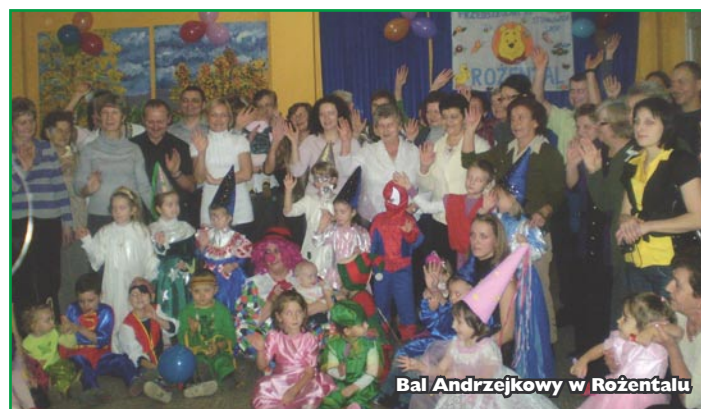
Bal Andrzejkowy w Rożentalu

Były one wspólną inicjatywą rodziców dzieci z Grup Zabawowych w Rożentalu, Rakowicach i Żłotowie, której pomysł wypracowano na warsztatach aktywności lokalnej w ramach projektów realizowanych przez Ośrodek Pomocy Społecznej Gminy Lubawa. Na warsztatach artystycznych rodzice szyli dla swoich pociec stroje karnawałowe, a uczestnicy Klubu Kulinarnych Podróżników z poszczególnych miejscowości upiekli ciasta i przyrządzili potrawy, które były poczęstunkiem w trakcie imprezy. Natomiast wychowawczynie z grup zabawowych przygotowały wspólnie z dziećmi cześć artystyczną, na którą składały się zabawy, wróżby andrzejkowe oraz tańce.