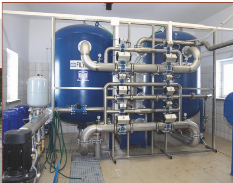
Rozbudowa stacji w Omule nastąpiła w ramach Programu Rozwoju Obszarów Wiejskich na lata 2007-2012

Modernizacja stacji uzdatniania wody w Omule jest czwartą (po stacjach: w Wałdytach, Targowisku i Łążynie) tego typu inwestycją, która zakończyła kompleksową modernizację gminnej sieci wodociągowej polegającą na pierścieniowym spięciu sieci gminnej. Oznacza to, że w przypadku awarii dostarczanie wody może odbywać się z różnych stacji. Rozbudowa stacji w Omule nastąpiła w ramach Programu Rozwoju Obszarów Wiejskich na lata 2007-2012. Zastosowano w niej układ dwustopniowy z 2 zbiornikami retencyjnymi po 50 tys. litrów każdy. Dzięki przeprowadzonej modernizacji jakość wody została dostosowana do obowiązujących norm. Zbiorniki w Omule pochodzą ze stacji uzdatniania wody w Wałdykach. Natomiast w Wałdykach zostały użyte nowe zbiorniki, każdy o pojemności 150 tys. litrów. Koszt przedsięwzięcia wyniósł ok. 1,05 mln zł i w 50 proc. został sfinansowany ze środków Unii Europejskiej.