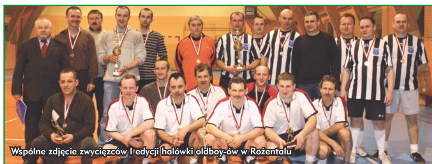
Wspólne zdjęcie zwycięzców I edycji halówki oldboy-ów w Rożentalu

Pozostałe drużyny biorące udział w mistrzostwach - Byszałd, Rożental, Zakład Północny Samplawa oraz drużyna radnych gminy Lubawa – otrzymały statuetki.