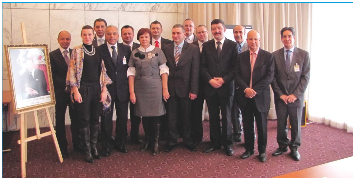
W spotkaniu z ministrem handlu zagranicznego oraz delegacją przedsiębiorców marokańskich wzięli udział prezesi i dyrektorzy firm: Libro, Construct, VBCH, Plast-Fol, Szytnaka Meble oraz wójt gminy Lubawa

Udział w forum był także okazją dla przedsiębiorców, aby zapoznać potencjalnych partnerów marokańskich ze swoją ofertą eksportową.