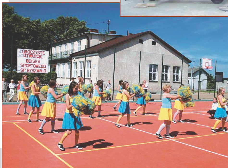
Podobne boisko od dwóch lat funkcjonuje w Byszwałdzie

Według planów pierwsze zajęcia w nowej sali odbędą się już we wrześniu