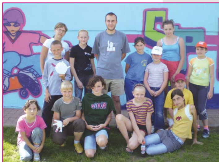
Graficy z Rożental

Od początku realizacji projektów z form wsparcia skorzystało ponad 800 osób. Wartość realizacji wszystkich siedmiu projektów, które są współfinansowane w ramach Europejskiego Funduszu Społecznego, wynosi 350.000 złotych.