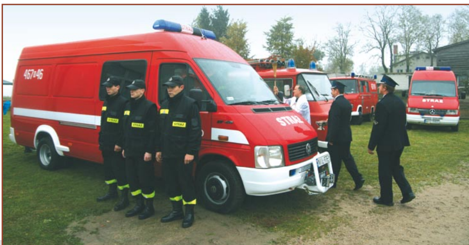
Nowy pojazd m.in. trafił do jednostki OSP Byszwałd

Natomiast w nowe pojazdy wyposażono jednostki: OSP Prątnica, OSP Rożental, OSP Byszwałd; podpisano także umowę z marszałkiem województwa warmińsko-mazurskiego na dofinansowanie samochodu pożarniczego dla jednostki OSP w Rożentalu (średni samochód ratowniczo-gaśniczy z funkcją ograniczania stref skażeń chemicznych). Dofinansowanie wyniesie 560 tys. zł.