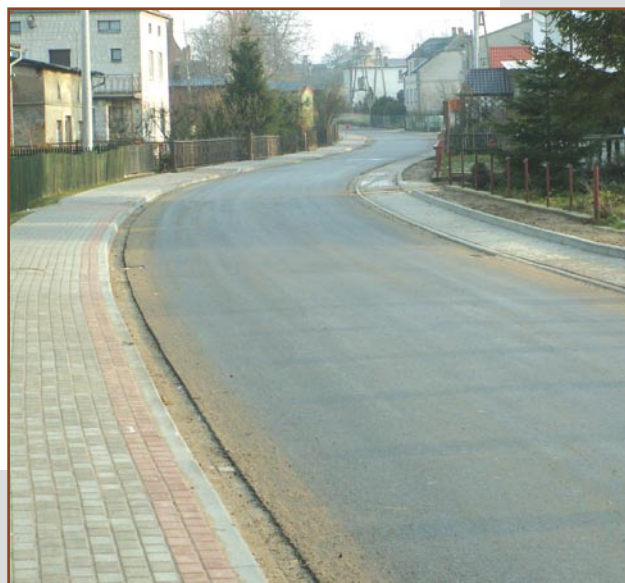
W tym roku zostanie dokończona przebudowa drogi m.in. w Byszwałdzie

Gmina Lubawa otrzymała dofinansowanie na przebudowę chodników w miejscowościach Kazanice oraz Władyki w ramach działania „Odnowa i rozwój wsi” objętego Regionalnym Programem Operacyjnym Warmia-Mazury 2007-2013. Kwota dofinansowania wynosi ok. 476 tys. zł .