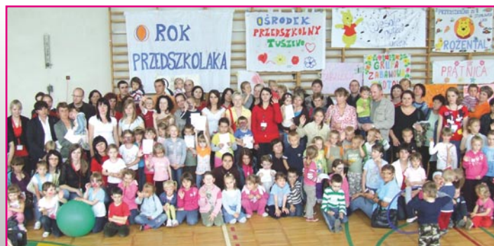
IV Piknik Majowy w Grabowie/Wałdykach

Należy podkreślić, że wiele działań związanych z aktywizacją mieszkańców i realizacją inicjatyw społecznych możliwa jest dzięki dobrze układającej się od wielu lat współpracy różnych podmiotów. Współdziałanie Ośrodka Pomocy Społecznej, gminnych szkół, Rad Sołeckich, Ochotniczych Straży Pożarnych, parafii rzymsko-katolickich i organizacji pozarządowych przyczynia się do ożywienia społecznego wsi i wzrostu kapitału społecznego, co w przyszłości z pewnością zaowocuje wieloma ciekawymi pomysłami.