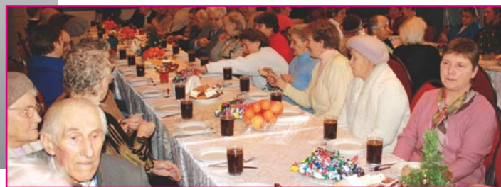
Gminne spotkanie wigilijno-opłatkowe w Rożentalu