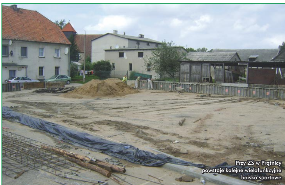
Przy ZS w Prątnicy powstaje kolejne wielofunkcyjne boisko sportowe