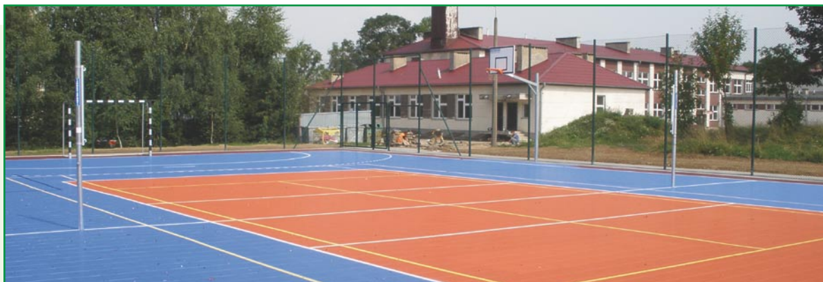
Boisko przy Zespole Szkół w Grabowie-Wałdykach