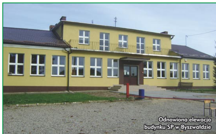
Odnowiona elewacja budynku SP w Byszwałdzie