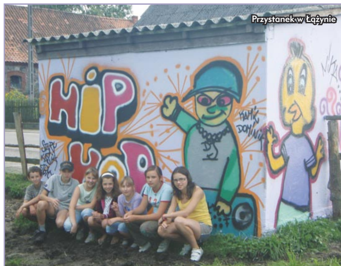
Przystanek w Łążynie