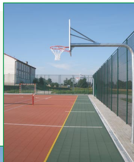
Boisko sportowe przy ZS w Kazanicach

Natomiast przy Szkole Podstawowej w Złotowie zakończyła się budowa sali gimnastycznej. Wartość obiektu o powierzchni prawie 740 m kwadratowych wyniosła ponad 1 mln 400 tys. zł. Inwestycję zrealizowało Lubawskie Przedsiębiorstwo Budowlane Z. Wierzbowski.