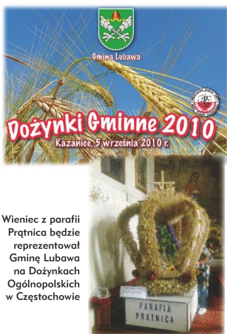
Wieniec z parafii Prątnica będzie reprezentował Gminę Lubawa na Dożynkach Ogólnopolskich w Częstochowie

Równocześnie na boisku wielofunkcyjnym odbędzie blok imprez sportowych, m.in. mecze tenisa ziemnego, pokazy skoku wzwyż oraz kick-boxing. W pobliżu sceny na smakośzy czeka Konkurs „Kuchnia Ziemi Lubawskiej”, w którym swoje potrawy zaprezentuje 11 ekip