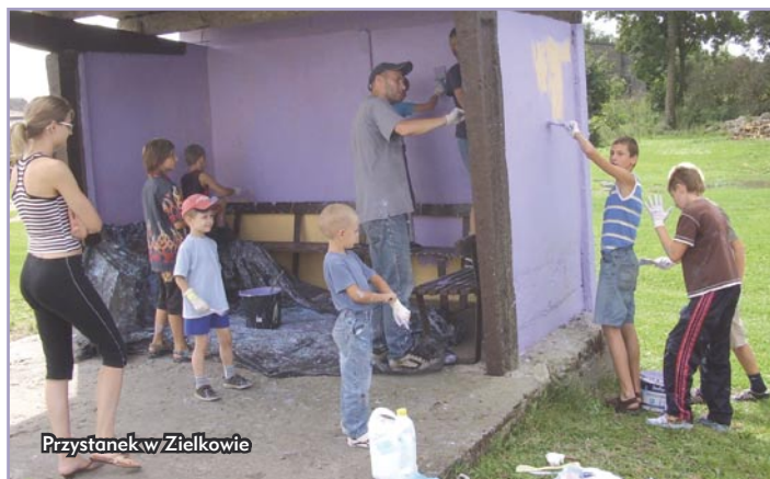
Przystanek w Zielkowie