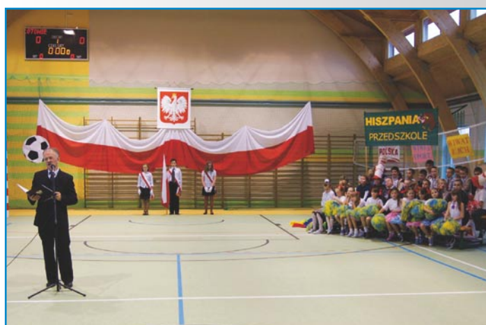
W sali zamontowano nowoczesny sprzęt sportowy, elektroniczną tablicę wyników oraz profesjonalne nagłośnienie