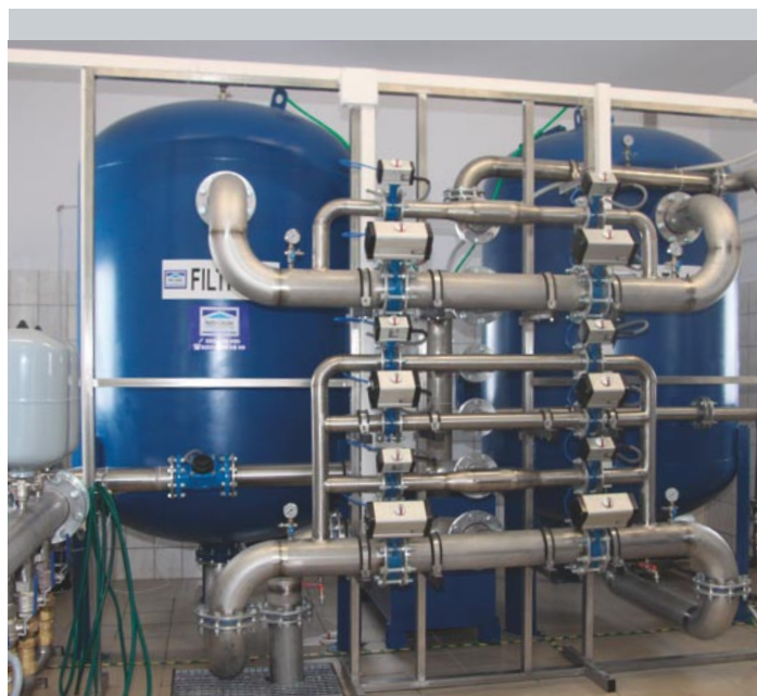
Stacja uzdatniania wody w Omulu

Stacja w Omulu dostarcza uzdatnioną wodę spełniającą wszystkie normy jakościowe mieszkańcom Omula, Szczepankowa, Napromka i Czerlina. W przypadku awarii wodociągów jest w stanie zaopatrzyć w wodę połowę mieszkańców lubawskiej gminy. Inwestycja w Omulu zakończyła kompleksową modernizację ujęć wody – jedno z ważniejszych zadań realizowanych przez Gminę.