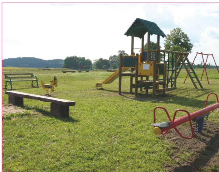
Plac zabaw w Szczepankowie