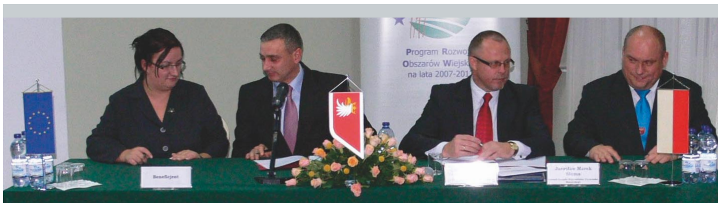
Podpisanie umów na dofinansowanie inwestycji w Pratnicy oraz Samplawie

Wartość projektu: 469.823,83 zł (brutto) Dofinansowanie: 75% od kwoty netto (288.826,00 zł) Program Rozwoju Obszarów Wiejskich na lata 2007-2013, działanie 313,322,323 „Odnowa i rozwój wsi”