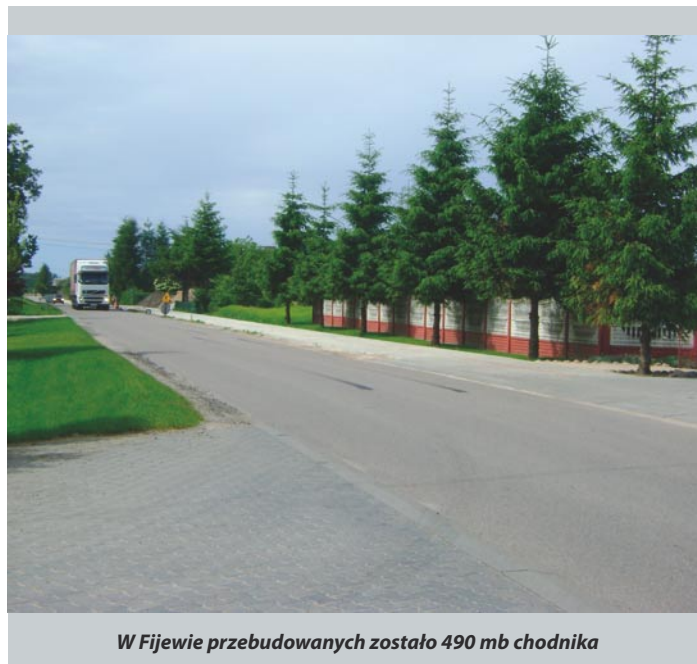
W Fijewie przebudowanych zostało 490 mb chodnika

* Łązek – Biała Góra odcinek około 1,0 km , szacunkowa wartość 30.000 zł