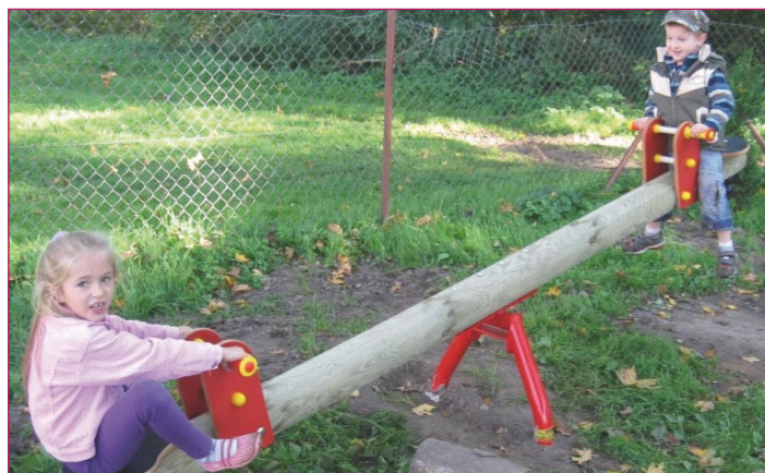
Plac zabaw w Rakowicach