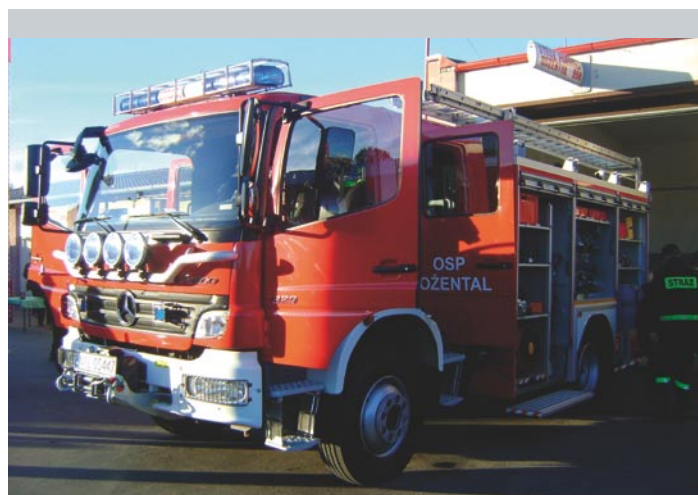
Najnowszy samochód OSP Rożental

Przyznane wsparcie w ramach Regionalnego Programu Operacyjnego Warmia – Mazury 2007 – 2013 umożliwiło wyposażenie jednostki Ochotniczej Straży Pożarnej w Rożentalu w specjalistyczny samochód ratowniczo-gaśniczy z funkcją likwidacji zagrożeń ekologicznych. Mercedes Benz Atego został przystosowany do prowadzenia akcji ratowniczych oraz współdziałania z innymi jednostkami specjalistycznymi. Zwiększyło to poziom bezpieczeństwa regionu zarówno w przypadku mieszkańców, uczestników ruchu drogowego (droga nr 15) oraz środowiska naturalnego (obszar otuliny Parku Krajobrazowego Wzgórz Dylewskich i Dorzecza Drwęcy). W wyposażeniu wozu znajduje się m.in. zbiornik wodny (2.500 l), zbiornik środka pianotwórczego (250 l), wysokociśnieniowa lina szybkiego natarcia (60 m) z elektrycznym zwijadłem, działko wodno-pianowe, pneumatyczny maszt oświetleniowy oraz wyposażenie związane z likwidacją zagrożeń ekologicznych. W 2010 r. Gmina ponownie inwestowała w wyposażenie jednostek Ochotniczych Pożarnych Gminy Lubawa. W nowe samochody oprócz Rożentalu zostały wyposażone także jednostki z Omula, Szczepankowa i Rumienicy.