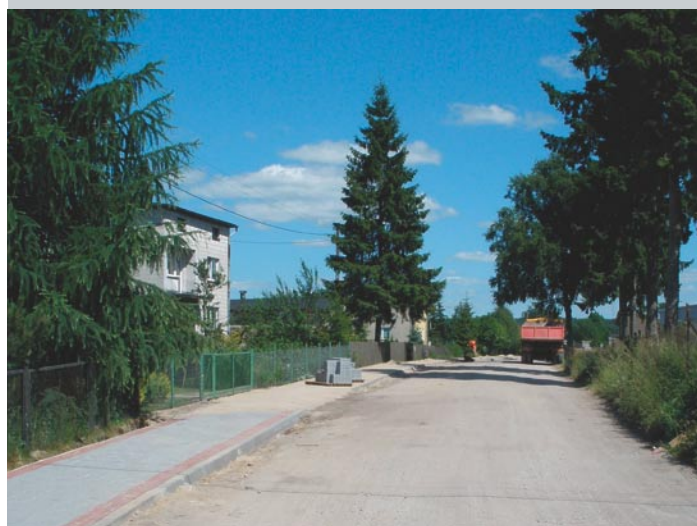
Przebudowa drogi w miejscowości Rodzone

Przedmiot zamówienia współfinansowany jest z Europejskiego Funduszu Rozwoju Regionalnego w ramach Osi Priorytetowej 5 – „Infrastruktura transportowa regionalna i lokalna”; Działanie 5.2 – „Infrastruktura transportowa służąca rozwojowi lokalnemu”, Poddziałanie 5.2.1 – „Infrastruktura drogowa warunkująca rozwój lokalny” objęty Regionalnym Programem Operacyjnym Warmia i Mazury na lata 2007 – 2013