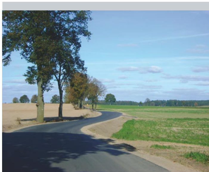
Przebudowa drogi w miejscowości Targowisko na odcinku 490 mb

Zielkowo odcinek 0,46 km. Zadanie realizowane było wspólnie z Powiatem Iławskim. Łączna wartość inwestycji to 640 tys.zł, dotacja Gminy Lubawa 320 tys. zł.