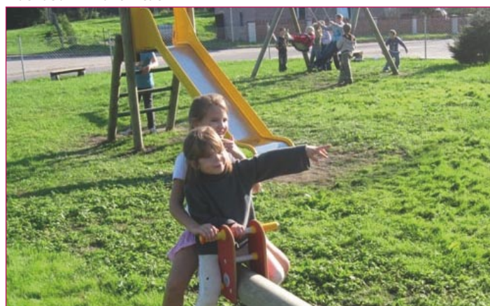
Plac zabaw w Mortęgach