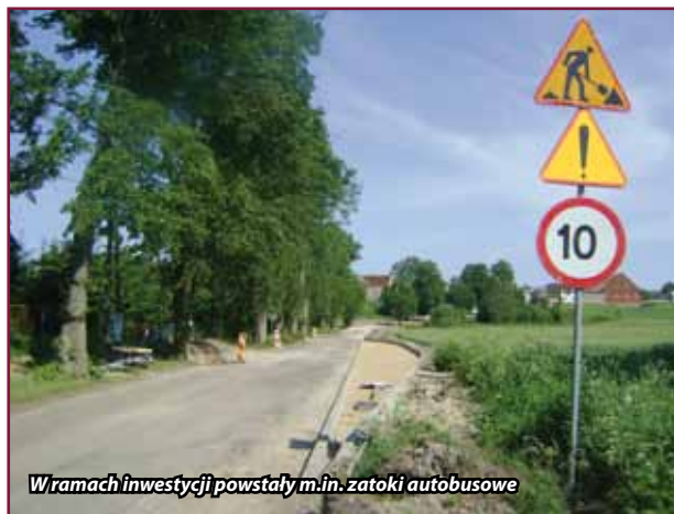
W ramach inwestycji powstały m.in. zatoki autobusowe

W lipcu zakończyła się przebudowa drogi gminnej w Targowisku Dolnym na odcinku ok. 1 kilometra. Był to kolejny etap modernizacji drogi gminnej w ciągu od drogi krajowej nr 15 do drogi powiatowej Lubawa – Targowisko – Rakowice. W ubiegłym roku wyremontowano 500 metrowy odcinek nawierzchni od „krajówki” do Targowiska. Koszt inwestycji wynosi 1 mln 289 tys. 189,13 zł. Zadanie w 50 proc. zostanie dofinansowane w ramach Narodowego Programu Przebudowy Dróg Lokalnych (tzw. „schetynówek”). Część druga inwestycji dotyczyła przebudowy mostu. Za kwotę 109 tys. 303,40 zł firma Skanska S.A. m.in. wykonała: roboty rozbiórkowe, roboty związane z wykonaniem nawierzchni i nasypów.