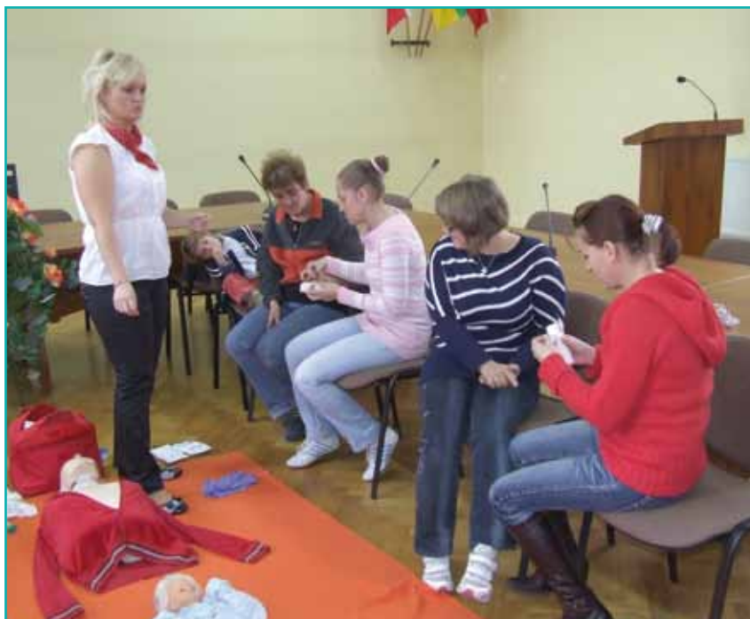
Uczestniczki podczas kursu zawodowego – Opiekunka środowiskowa