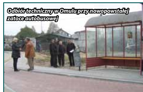
Odbiór techniczny w Omulu przynowopowstałej zatoki autobusowej