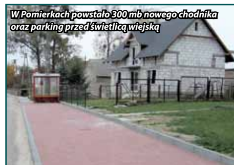
W Pomierkach powstało 300 mb nowego chodnika oraz parking przed świetlicą wiejską