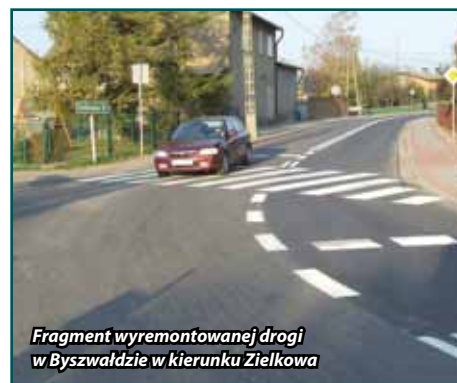
Fragment wyremontowanej drogi w Byszwałdzie w kierunku Zielkowa