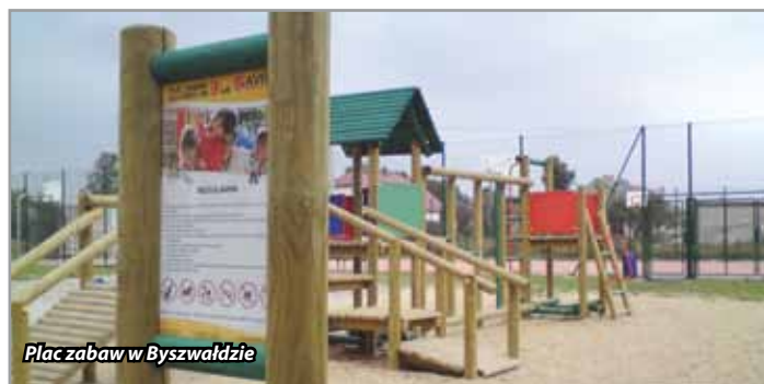
Plac zabaw w Byszałdzie

Środki na realizację inwestycji zapewnił Urząd Gminy Lubawa, wkład własny mieszkańcy wykonując nieodpłatnie prace przy ogrodzeniu oraz dostarczając drewno do budowy. Od wakacji dzieci mogą korzystać ze