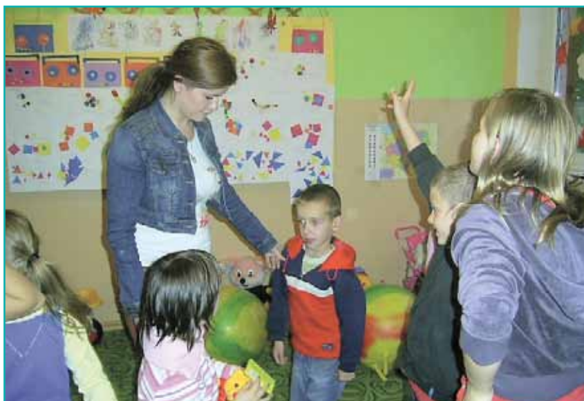
Dzieci podczas warsztatów socjoterapeutycznych