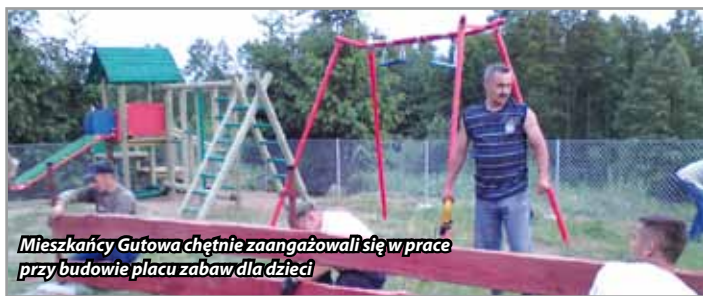
Mieszkańcy Gutowa chętnie zaangażowali się w prace przy budowie placu zabaw dla dzieci

Pod koniec października w Pomierkach zamontowano nowe wyposażenie placu zabaw przy świetlicy wiejskiej. Na dzieci czeka zestaw zabawowy i huśtawka. Modernizacja placu została zrealizowana ze środków własnych gminy.