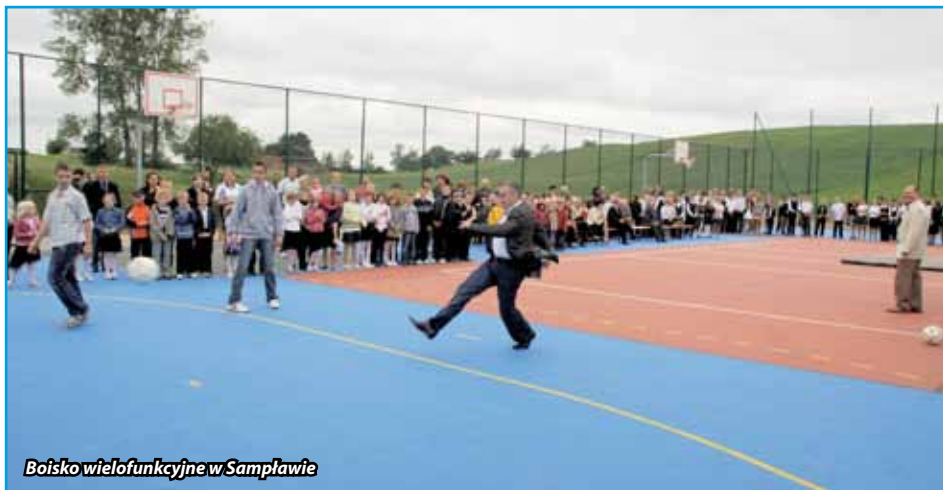
Boisko wielofunkcyjne w Samplawie

ziemnego. Jest antypoślizgowa, elastyczna, odporna na starzenie i promieniowanie UV oraz na uszkodzenia powodowane przez sportowe obuwie z kolcami. Dodatkową zaletą jest fakt, że nawierzchnie te są łatwe w konserwacji, a koszty ich utrzymania niewielkie.