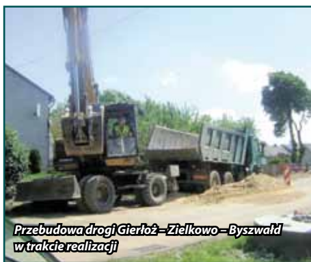
Przebudowa drogi Gierłoż – Zielkowo – Byszwałd w trakcie realizacji

Zakończyła się także inwestycja: przebudowa i remont chodników w miejscowościach: Władyki, Pomierki, Prątnica i Omule. Zadanie realizowała firma MUSA z Targowiska Dolnego za kwotę 241 tys. 812, 23 zł. W ramach zadania wybudowanych zostało łącznie ponad 1.200 mb chodników. Dodatkowo w Omulu powstała nowa zatoka autobusowa a w Pomierkach parking przy świetlicy wiejskiej. Przeprowadzone modernizacje zdecydowanie poprawiły estetykę wsi oraz bezpieczeństwo uczestników ruchu drogowego, w tym dzieci dojeżdżających do szkoły.