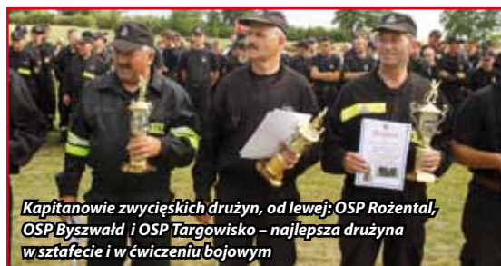
Kapitanowie zwyciężkich drużyn, od lewej: OSP Rożental, OSP Byszwałd i OSP Targowisko – najlepsza drużyna w sztafecie i w ćwiczeniu bojowym