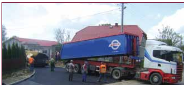
Ostatnie prace przy przebudowie drogi w Wałdykach

Pod koniec maja odbył się odbiór techniczny przebudowanej drogi gminnej (odcinek 360 m) w Wałdykach z udziałem wykonawcy, inspektora nadzoru, radnych z terenu Grabowo-Wałdyki oraz przewodniczącego komisji drogowej. Na dofinansowanie inwestycji w kwocie 100 tys. zł została podpisana umowa z Marszałkiem Województwa Warmińsko-Mazurskiego. Dotacja została przyznana ze środków budżetu województwa związanych z wyłączeniem z produkcji gruntów rolnych. Koszty budowy chodnika pokrył właściciel zakładu Construct. Inwestycję realizowało Przedsiębiorstwo Drogowo-Mostowe S.A. z Iławy.