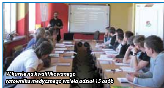
W kursie na kwalifikowanego ratownika medycznego wzięło udział 15 osób

W sobotę, 2 lipca uczestnicy szkolenia i zaproszeni goście uroczystie podsumowali 4-miesięczny udział w szkoleniu. Projekt był w 100 proc. finansowany przez Europejski Fundusz Społeczny w ramach działania: Oddolne inicjatywy edukacyjne na obszarach wiejskich. Kwota dotacji wynosi 49 tys. 880 zł.