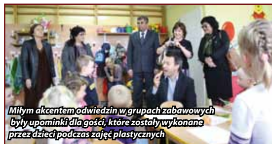
Miłym akcentem odwiedzin w grupach zabawowych były upominki dla gości, które zostały wykonane przez dzieci podczas zajęć plastycznych

W trakcie wizyty w Azji polscy przedstawiciele spotkali się również z trenerami fundacji „Step by Step” oraz rodzicami dzieci, które uczestniczyły w programie „Getting ready for school”.