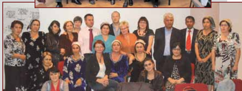
Wyjazd, odbył się w ramach projektu „Opracowanie alternatywnych modeli edukacji przedszkolnej”. Realizowany dzięki wsparciu finansowemu Fundacji im. Stefana Batorego, stanowi kolejną próbę polepszenia sytuacji edukacyjnej oraz zawodowej polskich, tadżyckich i kazachskich przedszkolaków.

departamentów edukacji i polityki społecznej, a także reprezentantów organizacji pozarządowych.