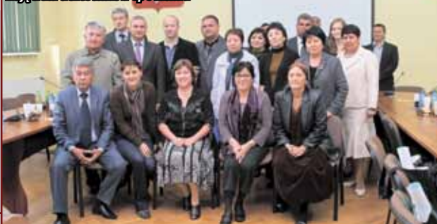
Pierwsza część wizyty zakończyła się wspólnym zdjęciem uczestników spotkania

Jednym z elementów rewizyty było także spotkanie „Okrągłego Stołu” w Dushanbe z udziałem doradcy prezydenta Tadżykistanu ds. społecznych, reprezentantów lokalnych władz tadżyckich oraz Ministerstwa Edukacji, przedstawicieli regionalnych i miejskich