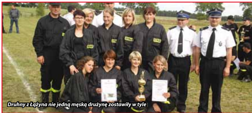
Druhny z Łążyńa nie jedną męską drużynę zostawiły w tyle

Klasyfikacja generalna, grupa kobiet: 1. OSP Łążyń – 135,84.