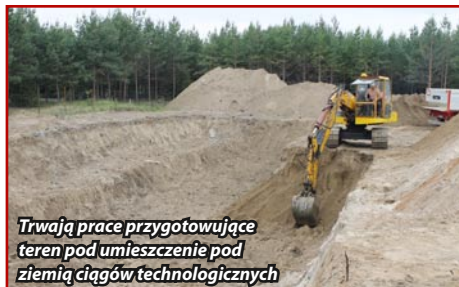
Trwają prace przygotowujące teren pod umieszczenie pod ziemię ciągów technologicznych

Realizację inwestycji zaczęto w połowie kwietnia tego roku. Pierwszy etap polegał na budowie sieci sanitarnej z przyłączami elektrycznymi i wodociągowymi oraz kolektorów ścieków. Do budowy sieci, której docelowo powstanie w Kazanicach 11 kilometrów, zastosowano jedną z najnowocześniejszych technologii w budownictwie – przewiertki sterowane. Obecnie prace przeniosły się w miejsce zlokalizowania oczyszczalni, gdzie powstaje budynek techniczny oraz przygotowują się teren na umieszczenie pod ziemię ciągów technologicznych, czyli zbiorników, komór i osadników. Wszystkie odpowietrzniki zostaną wyposażone w filtry eliminujące przykre zapa-