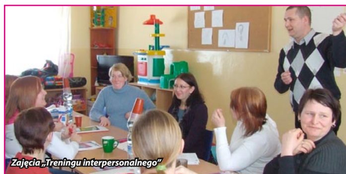
Zajęcia „Treningu interpersonalnego”