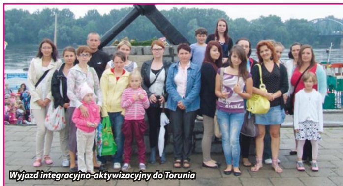
Wyjazd integracyjno-aktywizacyjny do Torunia