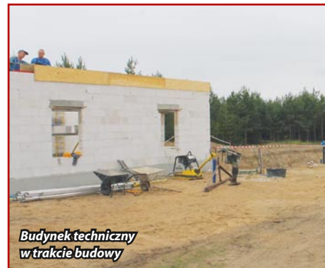
Budynek techniczny w trakcie budowy

Budowa biologicznej oczyszczalni ścieków w miejscowości Kazanice oraz kanalizacji sanitarnej ciśnieniowej będzie współfinansowana z Programu Rozwoju Obszarów Wiejskich na lata 2007-2013 w ramach podstawowych usług dla gospodarki i ludności wiejskiej.