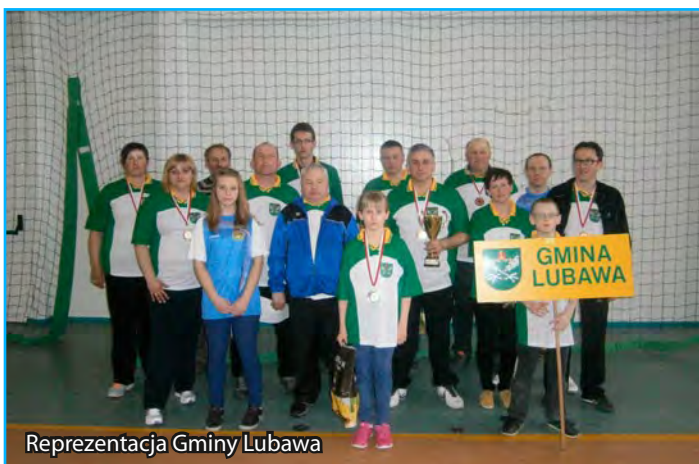
Reprezentacja Gminy Lubawa

W niedzielę, 6 kwietnia w Lidzbarku Warmińskim rozegrane zostały Wojewódzkie Halowe Igrzyska Samorządowe. Wśród 16 drużyn rywalizowała także reprezentacja Gminy Lubawa, która w klasyfikacji generalnej zajęła VI miejsce.