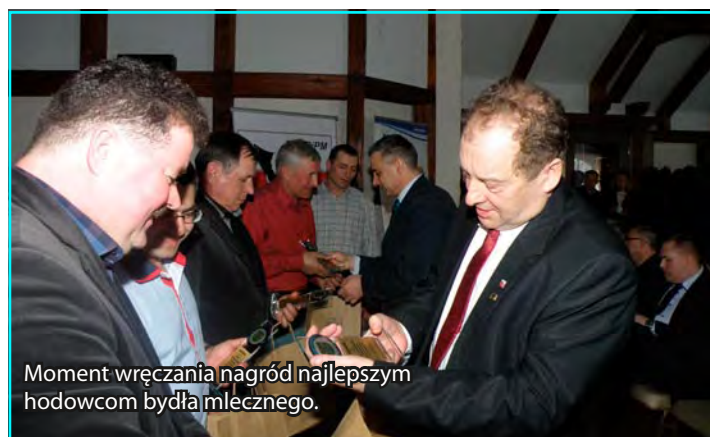
Moment wręczenia nagród najlepszym hodowcom bydła mlecznego.