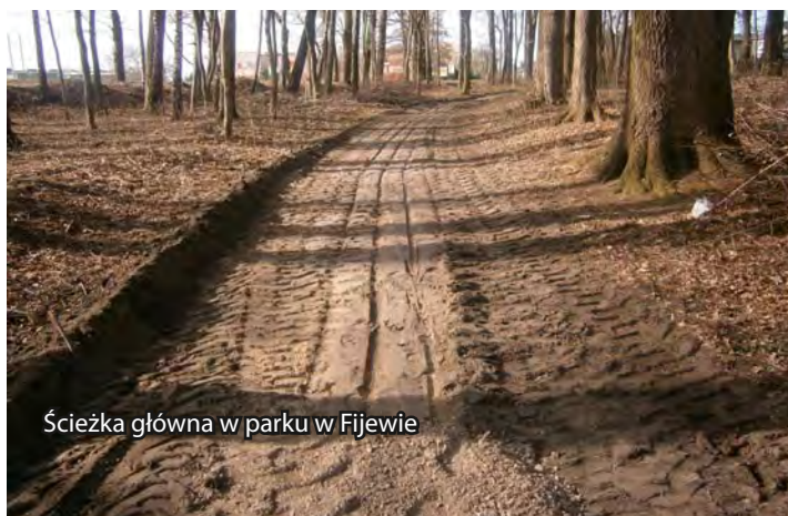
Ścieżka główna w parku w Fijewie

Trwają prace przy odnowieniu ścieżki głównej w parku w Fijewie. W ramach umowy zawartej przez Gminne Zrzeszenie LZS w Lubawie z Samorządem Województwa Warmińsko-Mazurskiego, m.in. zaplanowano: uporządkowanie terenu, nawiezenie tłucznia na ścieżkę oraz zamontowanie ławek i koszy na śmieci. Koszt przedsięwzięcia wynosi 31 tys. zł z czego prawie 25. tys. zostanie zrefundowane przez Urząd Marszałkowski w Olsztynie. Zakończenie prac przewidziano na pierwszą połowę maja.