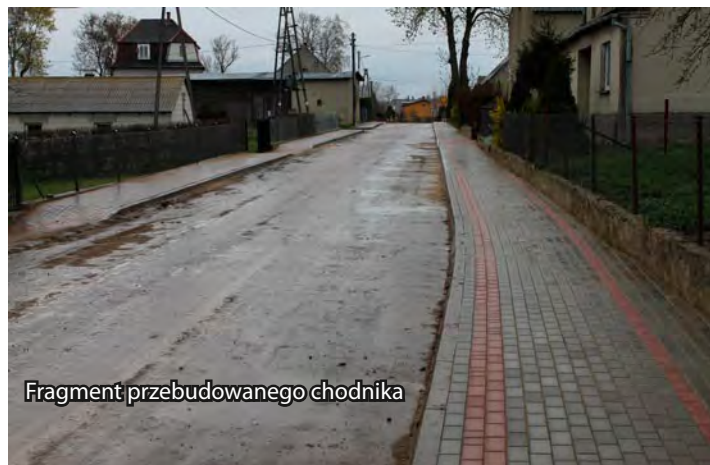
Fragment przebudowanego chodnika

W poniedziałek, 14 kwietnia odbył się odbiór techniczny inwestycji polegającej na przebudowie chodnika w miejscowości Omule (etap II). Łącznie w dwóch etapach (etap I zrealizowano w 2013 roku) przebudowano prawie 600 metrów bieżących chodnika, wykonano krawężniki i zjazdy za kwotę 129 tys. zł. Zadanie realizowała firma Usługi ziemne i wodnokanalizacyjne z Lubawy. W odbiorze uczestniczyli przedstawiciele inwestora – Gminy Lubawa, wykonawcy, inspektor nadzoru oraz radny i sołtys Omula.