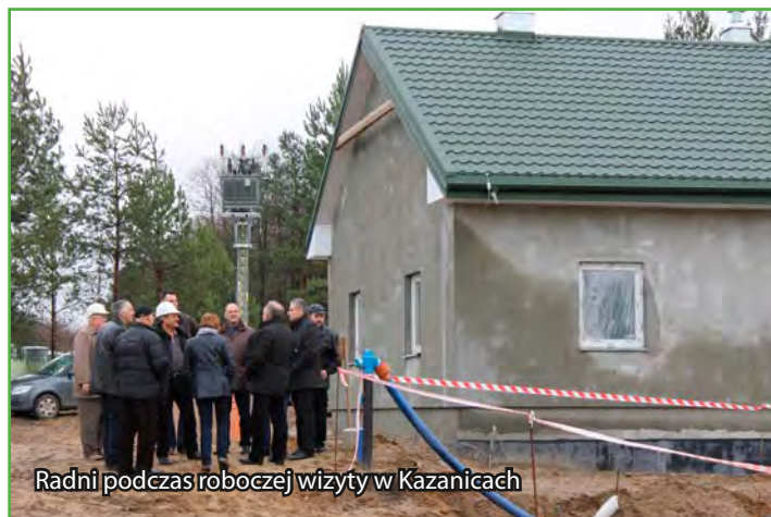
Radni podczas roboczej wizyty w Kazanicach

Trwają prace budowlane w Byszwałdzie przy pierwszym etapie budowy kanalizacji sanitarnej wraz z przyłączami. Zakończyła się już budowa kolektora ściekowego na odcinku od Kazanic do Byszwałdu. Prace główne przy budowie kanalizacji odbywają się obecnie w miejscowości Byszwałd.