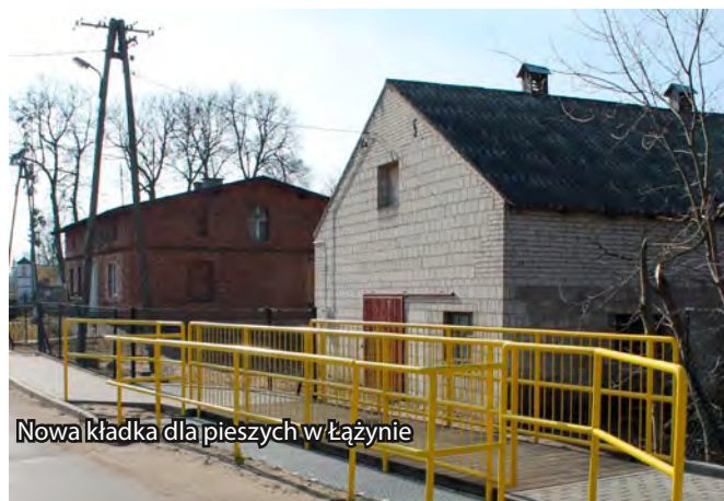
Nowa kładka dla pieszych w Łążynie