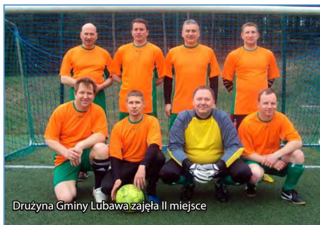
Drużyna Gminy Lubawa zajęła II miejsce