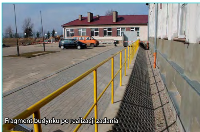
Fragment budynku po realizacji zadania

Trwają prace inwestycyjne na terenie gminy Lubawa. W Grabowie realizowane jest zadanie polegające na zabezpieczeniu budynku zespołu szkół przed wodami opadowymi i gruntowymi. Inwestycja o wartości prawie 190 tys. zł zostanie zrealizowana do końca maja 2014 roku. Jest to już trzeci, ostatni etap zadania, które konsekwentnie jest realizowane od 2011 roku. Do tej pory na ten cel przeznaczono już około 163 tys. zł. Przegląd gminnych inwestycji na stronach 3 i 4 biuletynu.