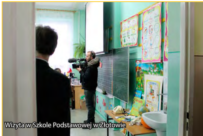
Wizyta w Szkole Podstawowej w Złotowie

Tematem reportażu jest rozwój gospodarczy gminy, szczególnie w zakresie branży meblarskiej oraz gminne inwestycje. Ekipa France 2, m.in. odwiedziła Szkołę Podstawową w Złotowie, zakłady Construct w Grabowie i Libro w Rodzonym. oraz obejrzała wielofunkcyjne boiska spotkowe. Wybór lubawskiej gminy do tematu reportażu nie był przypadkowy. Gmina Lubawa, która jest gminą typowo rolniczą od kilku lat zaczyna zmieniać charakter. Powstaje coraz więcej nowych oraz rozbudowują się zakłady przemysłowe zatrudniające po kilkuset pracowników każdy. Wskaźnik bezrobocia na terenie gminy wynosi ok. 5 proc.