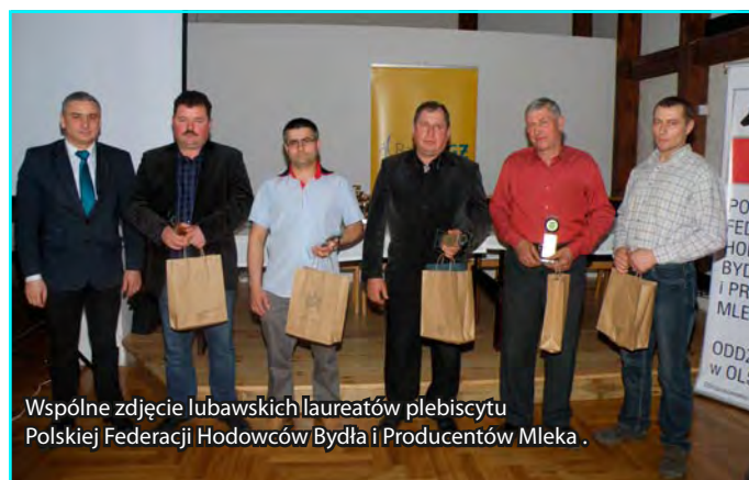
Wspólne zdjęcie lubawskich laureatów plebiscytu Polskiej Federacji Hodowców Bydła i Producentów Mleka.