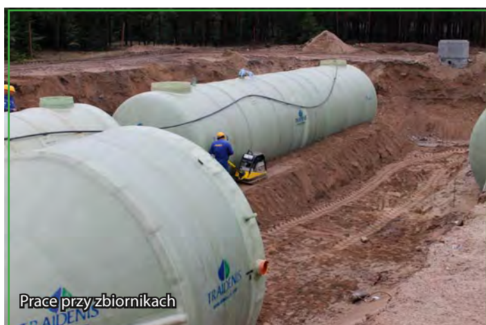
Prace przy zbiornikach