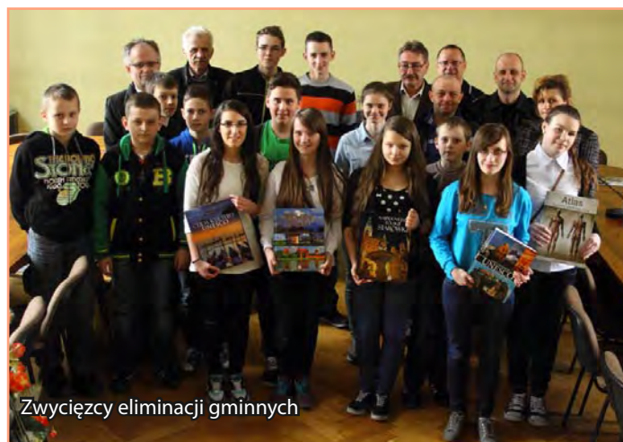
Zwycięzcy eliminacji gminnych