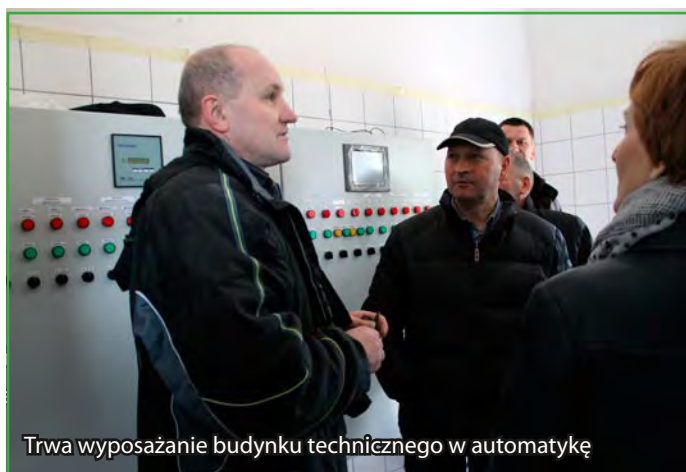
Trwa wyposażanie budynku technicznego w automatykę

Inwestycja przekraczająca wartość 1 mln zł, której zakończenie zaplanowane zostało na koniec sierpnia tego roku, zostanie dofinansowana w ramach PROW 2007-2014 w wysokości 50 proc. kosztów kwalifikowanych. W ramach zadania przewidziane jest także wykonanie sieci i przyłączy kanalizacyjnych dla połowy mieszkańców Byszwałdu.