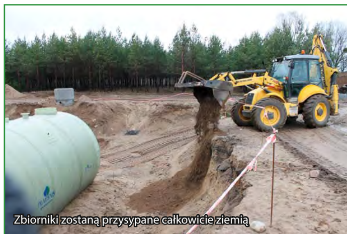
Zbiorniki zostaną przysypane całkowicie ziemią