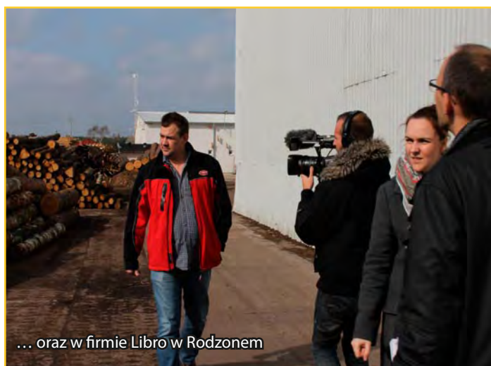
... oraz w firmie Libro w Rodzonym

– Niski wskaźnik bezrobocia, dynamiczny rozwój i rozbudowa zakładów