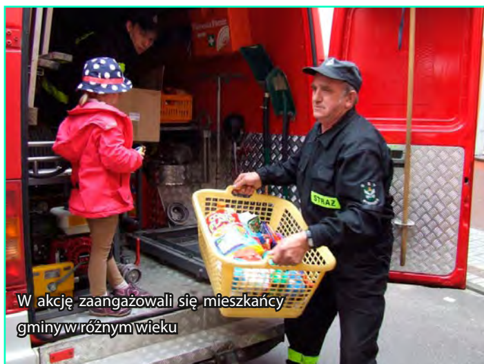
W akcję zaangażowali się mieszkańcy gminy w różnym wieku

Wolontariuszom, sklepom i OSP w Byszwałdzie serdecznie dziękujemy za pomoc w przeprowadzeniu zbiórki.