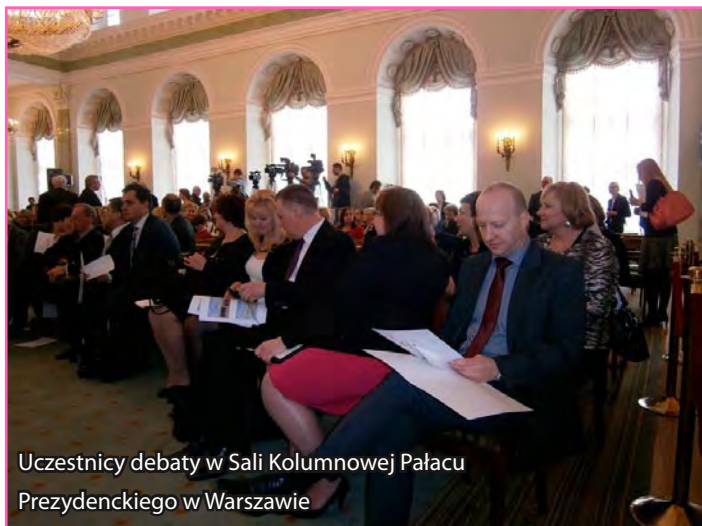
Uczestnicy debaty w Sali Kolumnowej Pałacu Prezydenckiego w Warszawie

Forum rozpoczął Prezydent Rzeczypospolitej Polskiej Bronisław Komorowski, który dziękował za dotychczasowe osiągnięcia w zakresie budowania dobrego klimatu dla polskiej rodziny, odniósł się także do kwestii wprowadzania Karty Dużej Rodziny; ustanowienia kwoty wolnej od podatku uzależnionej od liczby dzieci w rodzinie oraz problemów związanych z polityką mieszkaniową.