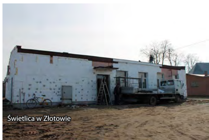
Świetlica w Złotowie

Mieszkańcy Łążyna mogą już korzystać z nowej kładki dla pieszych na rzece Struga. Kolejną inwestycją realizowaną w tej miejscowości będzie modernizacja miejscowego boiska przewidziana na wiosnę tego roku.