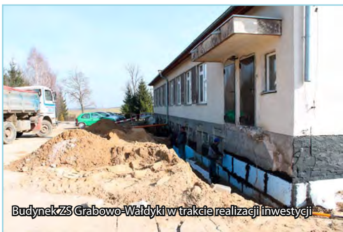
Budynek ZS Grabowo-Wałdyki w trakcie realizacji inwestycji

Trwają prace inwestycyjne na terenie gminy Lubawa. W Grabowie realizowane jest zadanie polegające na zabezpieczeniu budynku zespołu szkół przed wodami opadowymi i gruntowymi. Inwestycja o wartości prawie 190 tys. zł zostanie zrealizowana do końca maja 2014 roku. Jest to już trzeci, ostatni etap zadania, które konsekwentnie jest realizowane od 2011 roku. Do tej pory na ten cel przeznaczono już około 163 tys. zł. Przegląd gminnych inwestycji na stronach 3 i 4 biuletynu.