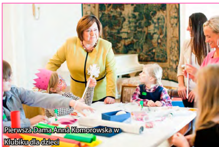
Pierwsza Dama Anna Komorowska w Klubiku dla dzieci