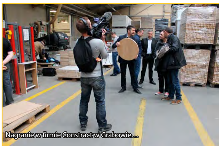
Nagranie w firmie Construct w Grabowie...

France 2 to główny kanał francuskiej telewizji publicznej. Jest on częścią grupy medialnej France Télévisions, w której skład wchodzi także France 3, France 4, France 5, RFO, ARTE France oraz France 24. Oferuje różne programy, m.in. wiadomości, wydarzenia sportowe i kulturalne, filmy oraz reportaże. Emisja materiału realizowanego na naszym terenie przewidziana jest na czwartek 1 maja. Po przesłaniu materiału przez France 2 reportaż będzie także dostępny na stronie: www.gminalubawa.pl , w zakładce videorelacje.