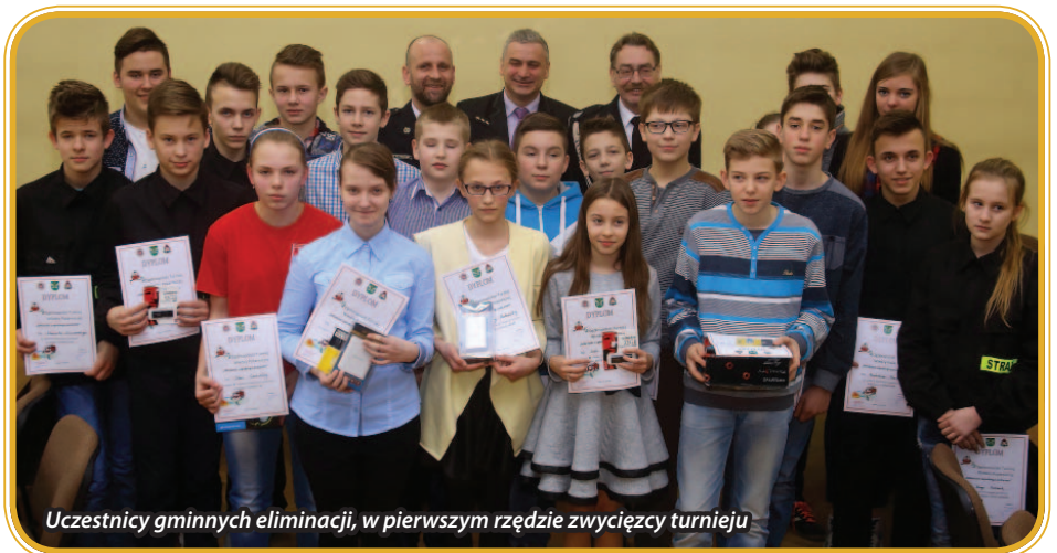
Uczestnicy gminnych eliminacji, w pierwszym rzędzie zwycięzcy turnieju