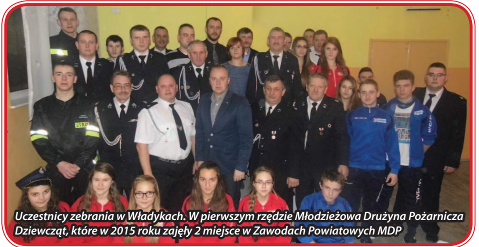
Uczestnicy zebrania w Władychach. W pierwszym rządzie Młodzieżowa Drużyna Pożarnicza Dziewcząt, które w 2015 roku zajęły 2 miejsce w Zawodach Powiatowych MDP