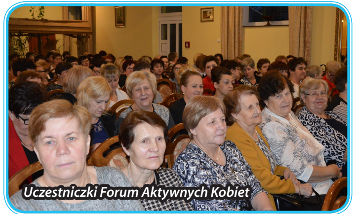
Uczestniczki Forum Aktywnych Kobiet