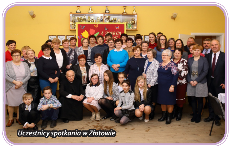
Uczestnicy spotkania w Złotowie

W gminie Lubawa odbył się „maraton” imprez z okazji Dnia Kobiet. Tegoroczne spotkania integracyjne odbyły się w: Targowisku, Złotowie, Rakowicach, Rumienicy, Omulu i Prątnicy. Tradycyjnie było mnóstwo życzeń, kwiatów i dobrej zabawy. Tego dnia panowie pełnili obowiązki gospodarzy i dbali o to, by każdej z kobiet niczego nie zabrakło. Natomiast uczestnicy świątlic i szkół zapewнили część artystyczną podczas spotkań, nie zabrakło piosenek, wierszy, skeczy oraz pokazów mody czy układów choreograficznych.