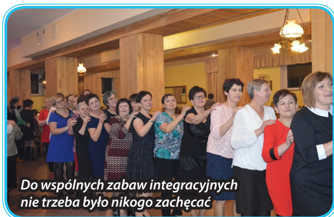
Do wspólnych zabaw integracyjnych nie trzeba było nikogo zachęcać