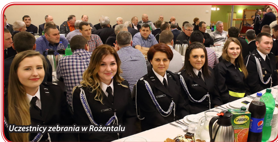
Uczestnicy zebrania w Rożentalu