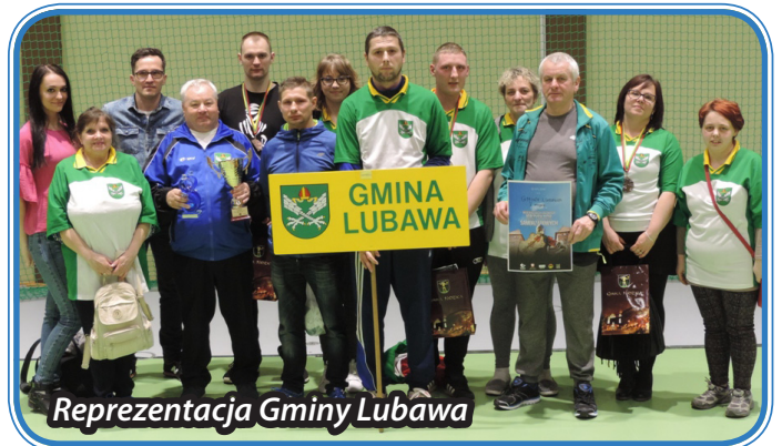
Reprezentacja Gminy Lubawa

Wszystkim zawodnikom, którzy reprezentowali Gminę Lubawa serdecznie dziękujemy.