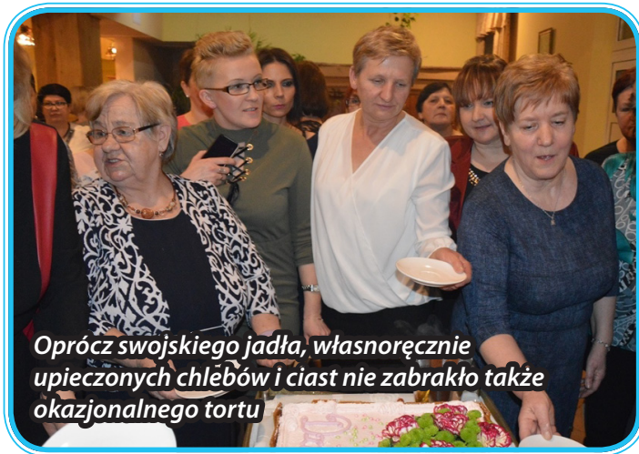
Oprócz swojskiegojadła, własnoręcznie upieczonych chlebów i ciast nie zabrakło także okazjonalnego tortu