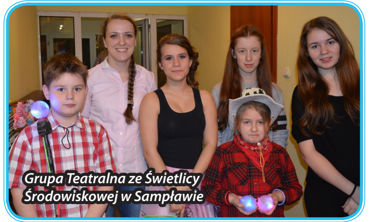
Grupa Teatralna ze Świątlicy Środowiskowej w Samplawie

Forum było okazją do dyskusji, wymiany doświadczeń i pomysłów na temat aktywności i integracji społecznej mieszkańców oraz kształtowania warunków trwałego rozwoju środowiska lokalnego. Warto dodać, że idea organizacji Forum spotkała się z pozytywnym przyjęciem jego uczestników i będzie kontynuowana w kolejnych latach.