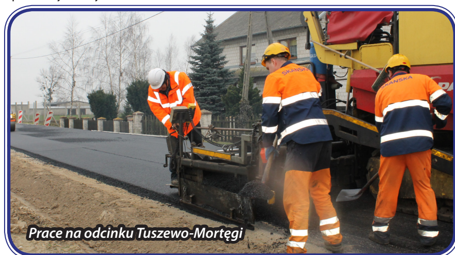
Prace na odcinku Tuszewo-Mortęgi

Trwa przebudowa dróg gminnych w miejscowości Tuszewo oraz w miejscowości Grabowo. Wartość obu zadań wynosi ponad 2 mln zł z czego 50 % zostanie dofinansowane w ramach „Programu rozwoju gminnej i powiatowej infrastruktury drogowej na lata 2016-2019”. W ramach inwestycji zostanie wykonana jezdnia, zjazdy na posesję oraz chodniki. Termin realizacji do końca lipca 2017 roku. W planach jest także m.in. przebudowa drogi gminnej w miejscowości Czerlin. Na to zadanie Gmina Lubawa otrzyma dofinansowanie w wysokości 90 tys. zł ze środków budżetu województwa związanych z wyłączenie gruntów z produkcji rolnej.