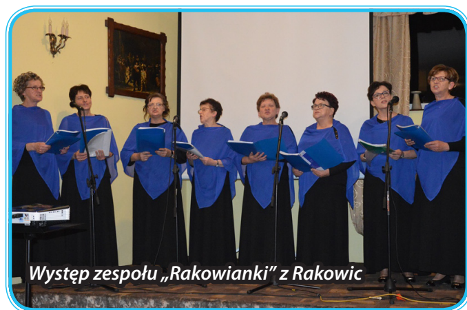
Występ zespołu „Rakowianki” z Rakowic