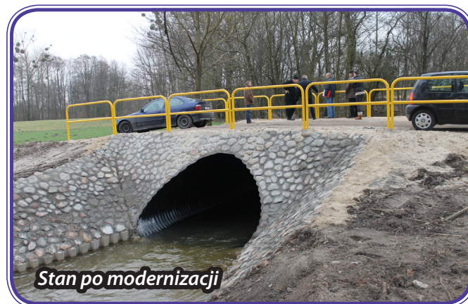
Stan po modernizacji

Zrealizowano przebudowę przepustu w miejscowości Samplawa na rzece Elszka - droga gminna. Stan obiektu przed modernizacją ograniczał ruch pojazdów. W miejsce rozebranego przepustu rurowego wykonano nowy przepust łukowo-kołowy ze stali karbowanej. Nawierzchnię jezdni nad przepustem oraz dojazdy wykonano z kruszywa. Skarpy zostały wzmocnione kamieniem polnym na zaprawie cementowo-piaskowej. Jezdnię ograniczono barierami ochronnymi. Koszt przebudowy wyniósł ponad 193 tys. zł. Prace zrealizowała firma PPUH MEL-KAN sp. z o.o. z Grudziądzka.