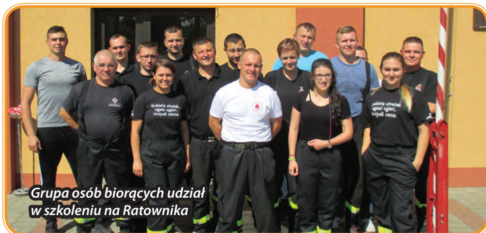
Grupa osób biorących udział w szkoleniu na Ratownika