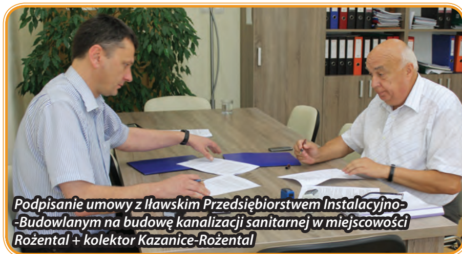
Podpisanie umowy z ławskim Przedsiębiorstwem Instalacyjno-Budowlanym na budowę kanalizacji sanitarnej w miejscowości Rożental + kolektor Kazanice-Rożental