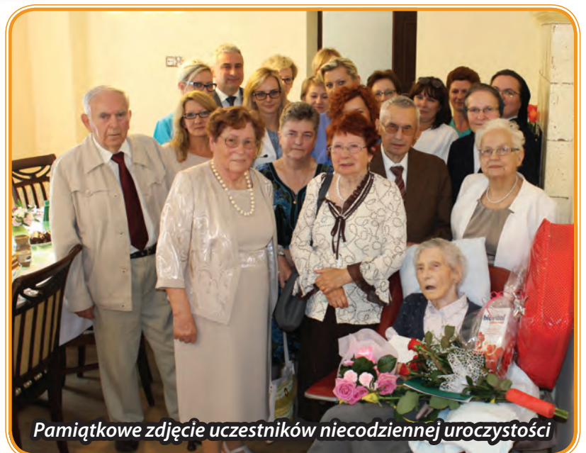
Pamiątkowe zdjęcie uczestników niecodziennej uroczystości