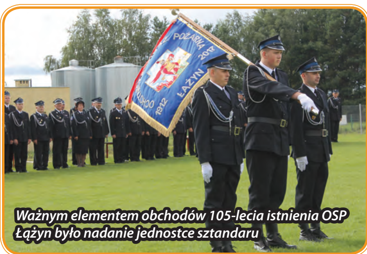
Ważnym elementem obchodów 105-lecia istnienia OSP Łążyn było nadanie jednostce sztandaru

Po zakończeniu oficjalnych uroczystości, przybyłych gości zaproszono na poczęstunek do świetlicy wiejskiej, a z nadejściem godziny 18 rozpoczął się blok rekreacyjno- artystyczny.