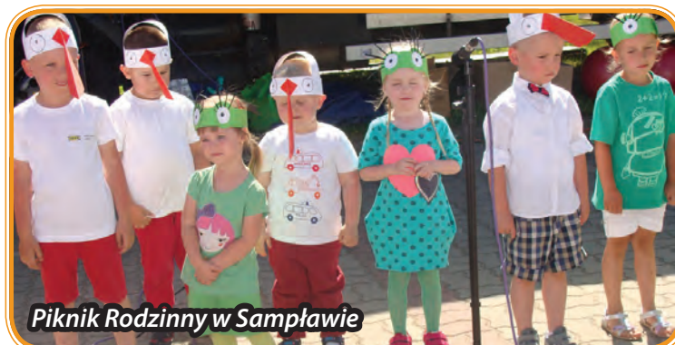
Piknik Rodzinny w Samplawie