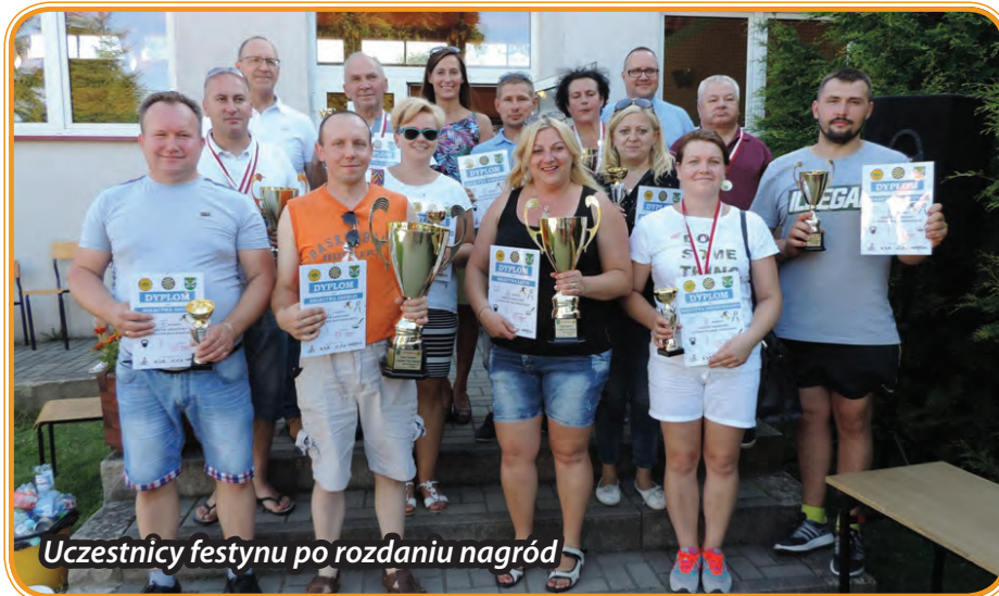
Uczestnicy festynu po rozdaniu nagród

Impreza została sfinansowana ze środków Gminy Lubawa w ramach realizacji zadania publicznego „Wspieranie i upowszechnianie kultury fizycznej - zapewnienie aktywnego sposobu spędzania wolnego czasu mieszkańcom Gminy Lubawa poprzez powierzenie organizacji imprez sportowych”.