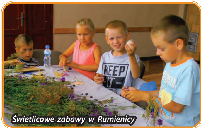
Świetlicowe zabawy w Rumienicy

Wakacyjne Świetlice już od kilku lat funkcjonują w okresie letnim na terenie gminy Lubawa. W tym roku, poza 9 placówkami działającymi przez cały rok, powstało także 8 wakacyjnych placówek w miejscowościach: Byszałd, Gutowo, Lubstynek, Łążek, Omule, Rumienica, Tuszewo i Zielkowo. Uczęszczają do nich łącznie ok. 300 osób. Dzieci i młodzież z terenu gminy mogli uczestniczyć w zorganizowanych przez wychowawców zajęciach i w aktywny oraz kreatywny sposób zagospodarować swój czas wolny. Świetlice oferowały m.in.: wycieczki rowerowe, wycieczki edukacyjno-krajoznawcze, warsztaty graffiti, noclegi w świetlicy, zajęcia kulinarne i artystyczne oraz wiele innych atrakcyjnych zajęć.