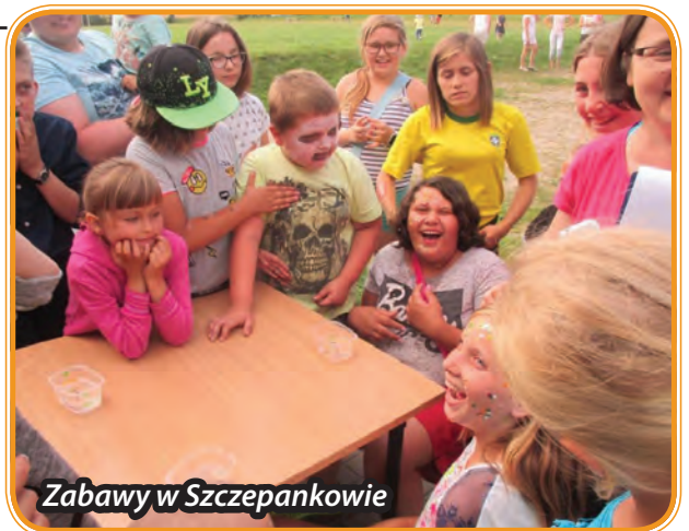
Zabawy w Szczepankowie