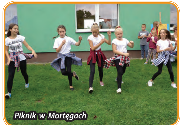
Piknik w Mortęgach