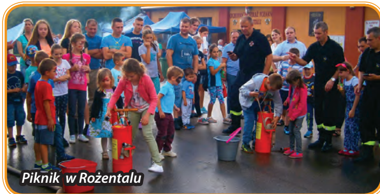
Piknik w Rożentalu

Łącznie odbyło się 13 pikników, podczas których zapewniono wiele atrakcji ich uczestnikom. Podczas części artystycznych można było obserwować lokalne talenty, sprzyjająca pogoda i atmosfera imprez zachęcały do integracji przy wspólnych grach i zabawach.